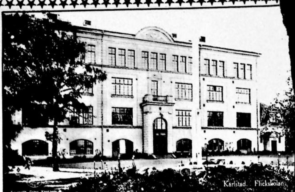
Flickskolan i Karlstad.