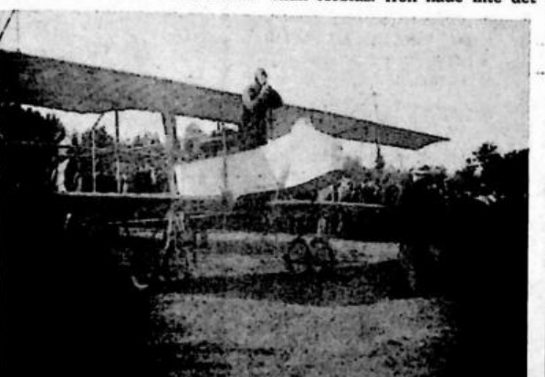
Den 5 oktober 1913 landade den franske flygaren Maurice Chevallard.